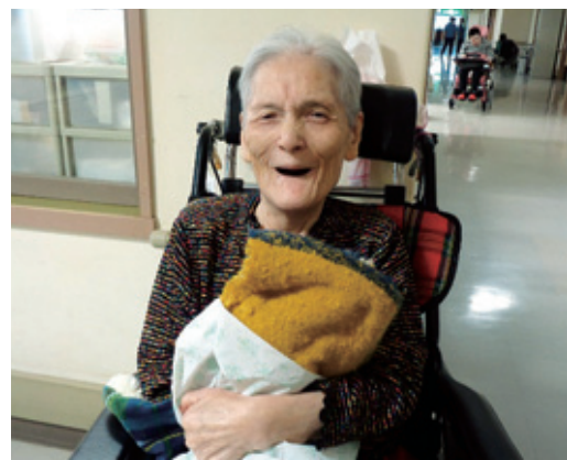
「プレゼントをありがとう!」

風船バレー、黒ひげ危機一髪などのゲーム大会を行い、利用者様にプレゼントを贈呈いたしました。その後、ミスタードーナツのドーナツやアイスを食べました。