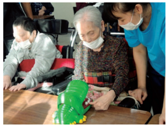
「ワニに噛まれたら負けよ！」

令和4年12月 第80号 発行 社会福祉法人新生会 障害者支援施設あかまつ園 住所 青森県十和田市大字大沢田 字早坂194 TEL 0176-27-2126 FAX 0176-27-2127 Eメール akamatsu@sea.plala.or.jp ホームページ http://sinseikai.jp