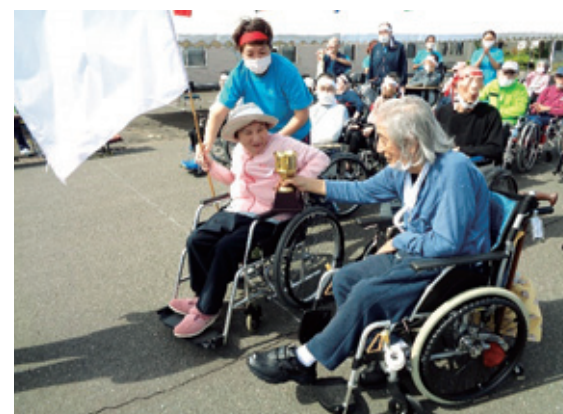
2年ぶりの優勝カップです。

9月27日 運動会を行いました。今年も天候に恵まれ、応援の声も活気に溢れていました。接戦の末、白組の勝利となりました。昨年のリベンジを果たしました。