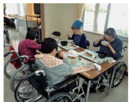
食べるのに夢中です。

運動会の後は、芋煮会として秋の旬の食材が使われた昼食を、おいしそうに食べていました。