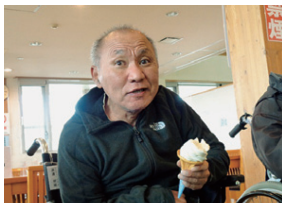
名物シジミソフトです。

館内を散策し、ソフトクリームを食べ、池や遊覧船を観覧しました。ソフトクリームが好評でした。