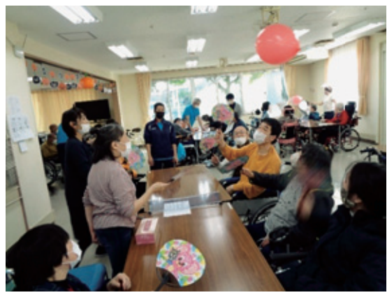
風船バレーをする利用者様