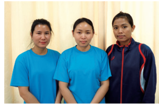
「これからもヨロシクね。」

風船バレー、黒ひげ危機一髪などのゲーム大会を行い、利用者様にプレゼントを贈呈いたしました。その後、ミスタードーナツのドーナツやアイスを食べました。