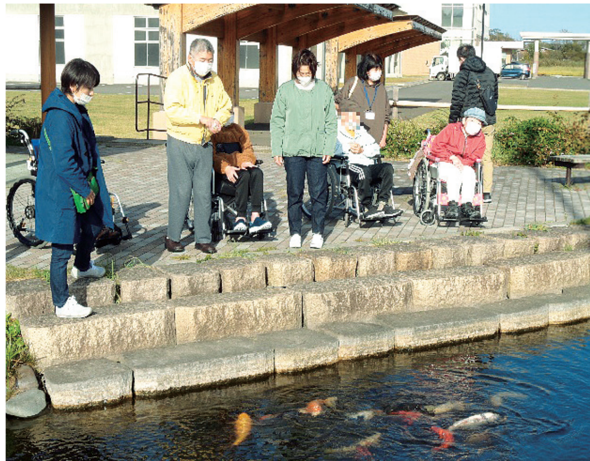
コイに餌をあげています。