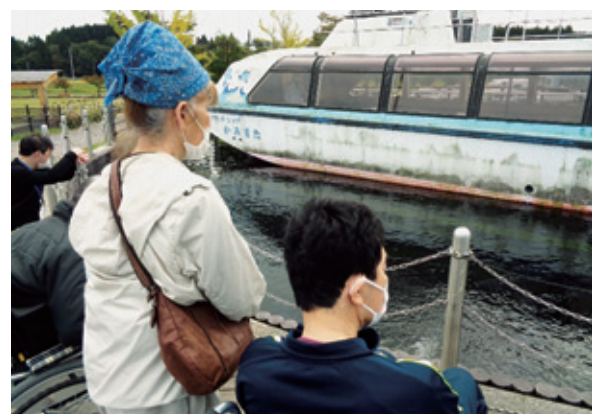
「昔は小川原湖で運航していたんだよ。」