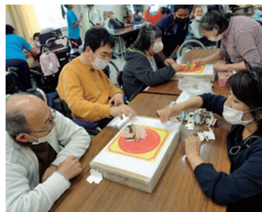
「のこった!のこった!」